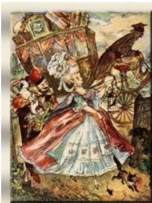
Ilustracja nr 1.

Obejrzyj zamieszczone poniżej ilustracje.