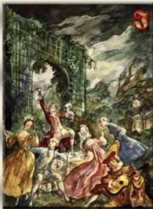
Ilustracja nr 2.

Jakie zdarzenia z satyry Żona modna zostały przedstawione na ilustracjach 1. i 2.? W odpowiedzi odwołaj się do znajomości całego utworu.